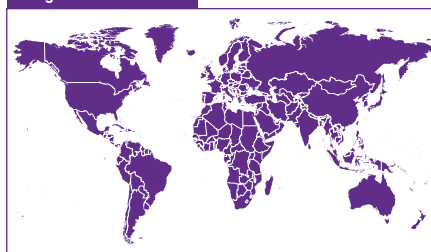
De gewone wereldkaart

Toch zijn er pas vijf landen (Nederland, Zweden, Noorwegen, Denemarken en Luxemburg) die dit percentage halen. Wereldwijd ligt het gemiddelde nu op 0,30%. Als alle landen 0,7% van hun inkomen opzij zouden leggen, zou de totale hulp stijgen van $119 miljard naar $279 miljard.