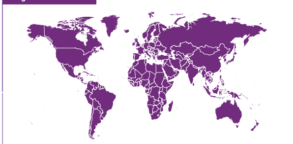
De gewone wereldkaart

Gegevens: Education for All Monitoring Report 2008 (gegevens betreffen 2006). Landen zonder gegevens: schatting Mapping Worlds.