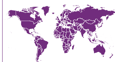
De gewone wereldkaart

De internationale armoedegrens van $1,25 per dag is gebaseerd op een vergelijking van lokale koopkracht. De berekening van de oppervlakten is gebaseerd op het armoedepercentage (Wereldbank, World Development Indicators 2008) en het bevolkingsaantal (UN Population Division). De armoedegegevens hebben betrekking op uiteenlopende jaren, zijn in een aantal gevallen een schatting van Mapping Worlds en betreffen alleen lage- en middeninkomens-landen.